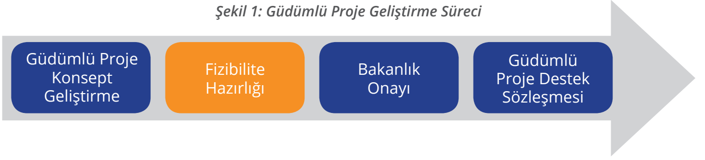
Şekil 1: GÜDÜMLÜ PROJE GELİŞTİRME SÜRECİ

eğitim ve araştırma altyapılarının güçlendirilmesi, nitelikli girişimcilerimizin çoğalması, ihracat kapasitesinde artış, teknoloji transferinin sağlanması, bilgi tabanlı teknolojilerin geliştirilmesi, sağlık sektöründe küresel bir merkez olmak gibi çeşitli alanlarda birbirinden önemli hedeflere sahip olan bu projeler, İSTKA'nın GÜDÜMLÜ PROJE DESTEĞİ sayesinde İstanbul'a kazandırılmaktadır.